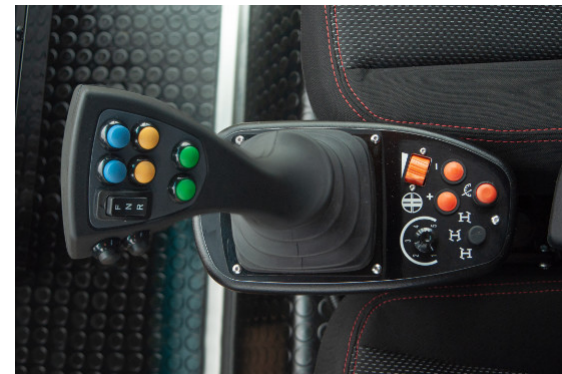
Multifunktionsjoystick inkl. Bedientasten für verschiedene Arbeitsmodi, Lenkungsarten, Tempomat, Handgas sowie Fahrtrichtungsschalter // Multifunctional joystick incl. control buttons for different working modes, different types of steering, cruise control, hand throttle as well as a direction switch