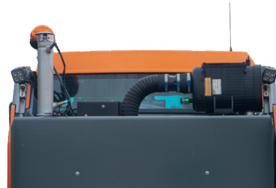
LED-Arbeitscheinwerfer hinten // LED-rear working lights