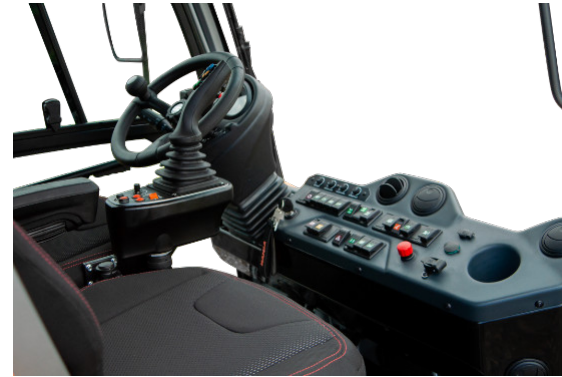
Komfortables Kabinenkonzept inkl. individuell verstellbarer Armlehne // Comfortable driver's cabin incl. an individual adjustable armrest