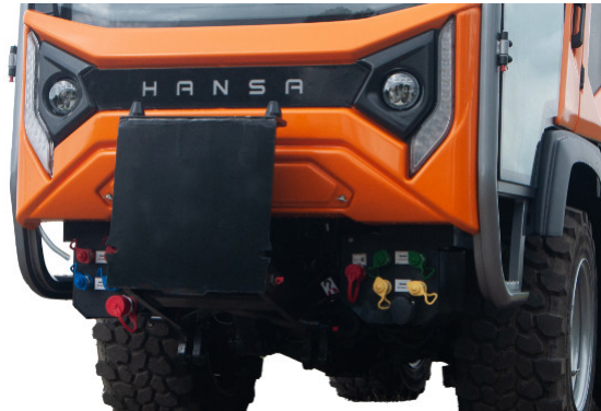
Massive Frontanbauplatte mit Parallelführung // Massive front mounting plate with parallel guide