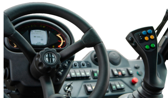
Kombiinstrument mit Serviceanzeige // Combi instrument with service indicator