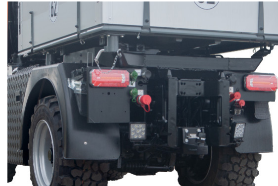
Schwere Anbautraverse zur Aufnahme von Heckanbaugeräten // Lifting beam for picking up rear mounted equipment