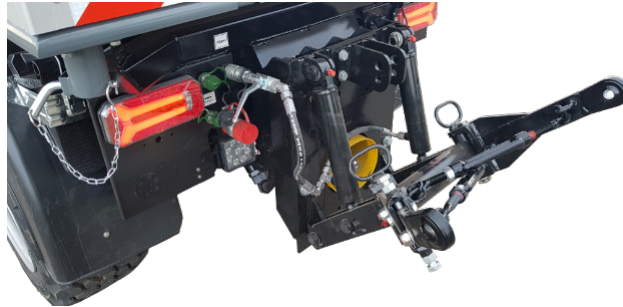
Heck-3-Punkt-Aufnahme mit leistungsstarker Zapfwelle // 3-point-rear-pick-up with powerful PTO shaft