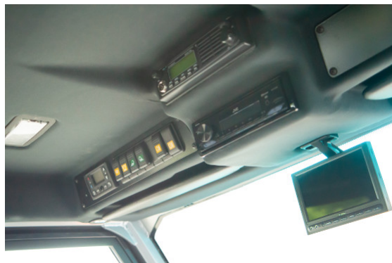
DAB+ Radio mit Bluetooth-Freisprecheinrichtung, Rückfahrkamera // DAB+ radio with bluetooth hands-free module, rearview camera