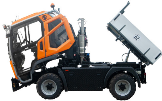
Fahrerhaus und Ladefläche hydraulisch kippbar // Hydraulically tiltable driver's cabin and platform