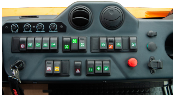
Kundenindividuelles Armaturenbrett // Customized dashboard