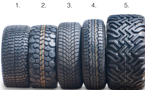
REIFEN // Tires 1. 315 / 55 R 16 Rasenprofil // Lawn profile 2. 315 / 55 R 16 MPT 3. 285 / 65 R 16 4. 265 / 75 R 16 5. 440 / 50 R 17