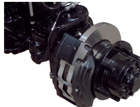
Überdimensionierte Scheibenbremse mit optischer Verschleißanzeige // Oversized disc brake with visible indication