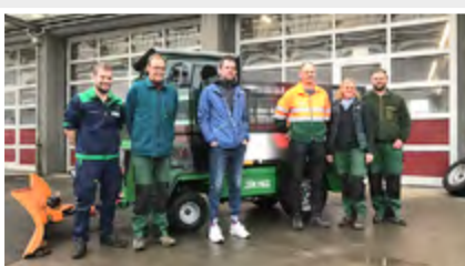
Ein neuer Schmitz Minikipper für die Baudirektion Grenchen