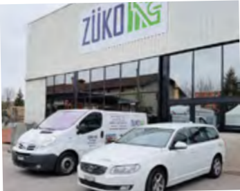
DIE ZÜKO-WERKSTATT IN BULLE

Die ZÜKO-Service Nummer für die französische Schweiz: 026 913 90 21.