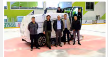
Eine neue WM Mammoth für die Eishalle Lerchenfeld, St. Gallen