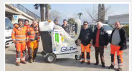
Ein neuer Glutton 2411 Electric für Municipio di Brissago