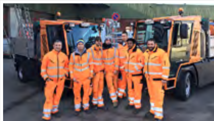
Zwei neue Hansa APZ1003 für die Stadt Winterthur