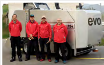
Eine neue WM EV02 für die Eisbahn Brand, Thalwil